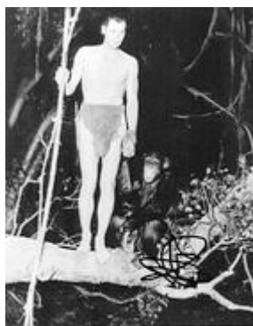
Cita e Weissmuller

LONDRA - Ricordate Cita, la scimmia più famosa al mondo nonché compagna (cinematografica) di Tarzan in una cinquantina di film? A 76 anni suonati (venne trovato in Africa che era un neonato nell'aprile del 1932), questo scimpanzé maschio, entrato nel Guinness dei Primati come il più anziano esemplare vivente della sua specie, è ancora una gran bellezza e da una decina di anni si sta godendo la meritata pensione nell'assolata Palm Springs, in California, in un centro specializzato, dove si diletta a dipingere (i suoi quadri astratti, con tanto di certificato di autenticità, vengono venduti a 75 sterline, pari a 94 euro, e il denaro ricavato serve per il suo mantenimento), suonare il pianoforte e passeggiare sulla spiaggia. Non solo. Da tempo si dice che stia scrivendo la sua autobiografia, intitolata «Me, Cheeta», e a quanto pare il volume dovrebbe essere dato alle stampe in autunno, anche se la rivista Esquire ne ha annunciato la pubblicazione di alcuni estratti per il prossimo mese.